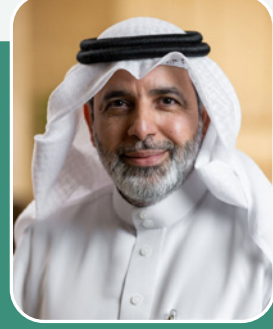
إعداد: وليد محمد الحمادي

- من عرفة عن قرب يذكر كثرة تسبيحه وذكره لله عز وجل، كما يذكر حسن معاملته ودوام ابتسامته التي لم تكن تفارق مُحَيَّاه. وكان رحمه الله دائماً السَّوَال والنَّفَقْد لجميع إخوانه. كما عُرف بسعيه في حجة الناس وإغاثة الملهوف.