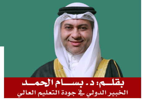
بقلم: د. بسام الجهد الخبير الدولي في جودة التعليم العالي

تُعرّف الأمية الأكاديمية في الوسط الجامعي بقدرّة أعضاء هيئة التدريس على التفكير وإنتاج الفكر في الوسط الأكاديمي، ولكن قد يترافق ذلك عملياً بعدمية الإنتاج العلمي، وغياب إمكانات التفاعل والتخاطب بين الذات والآخر في الوسط الأكاديمي وفي محيطه الخارجي، كما تعني عدم القدرة على مواكبة مستجدات المعرفة الحية في مختلف جوانب الحياة، وعدم القدرة على التجاوب المعرفي مع معطيات الحضارة ومنجزاتها الإنسانية والتقنية. وتظهر أعراض هذه الأمية في عدة صور: منها ما يتعلق بالتصلب الفكري، وهيمنة اللامبالاة وضيق الأفق مع ضعف وتيرة الإنجاز في ميدان التخصص. وعادة ما يمتد تأثير ذلك على غياب الإبداع في المجالين الثقافيين والمعرفيين.