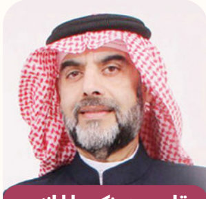
بقلم: د. زكريا الخنجي