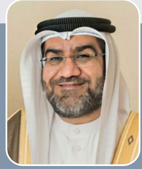
بقلم: الشيخ عبدالناصر عبداللّٰه