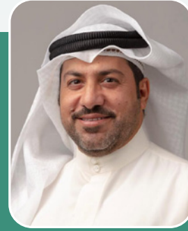
بقلم: عبدالرحمن جاسم عبيدان فخره

بعد تخرجه من الثانوية العامة توجه إلى دراسة الحقوق بجامعة الإمارات العربية المتحدة وتخرج في العام 1983 بحصوله على الليسانس في القانون/ تخصص شريعة وقانون من كلية الحقوق والشريعة من جامعة الإمارات وكان تقديره العام جيد جداً وهو ما أهّله للتكريم