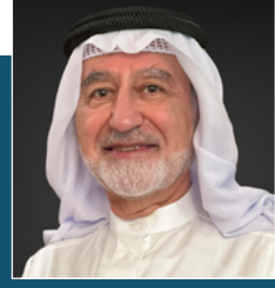
بقلم: أ.د. علي محمد نور المدني