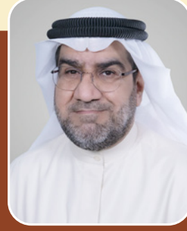
بقلم: الشيخ عبد الناصر عبد الله