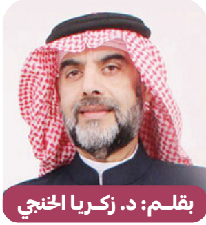
بقلم: د. زكريا الخنيجي