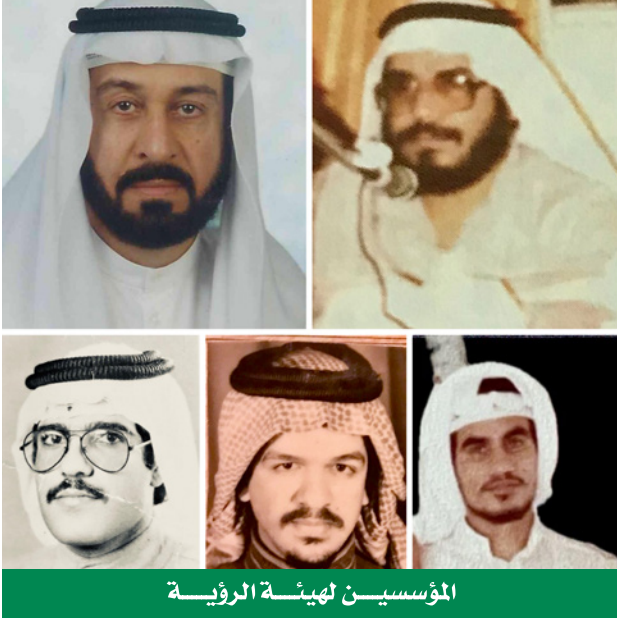
المؤسسين لهيئة الرؤية

وعن هذا النشاط الجميل لسنوات عديدة بعدها.