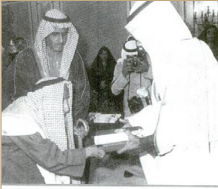
سمو رئيس الوزراء يكرم الشيخ عبد الرحيم روزبه ويسلمه جائزة الدولة للعمل الوطني