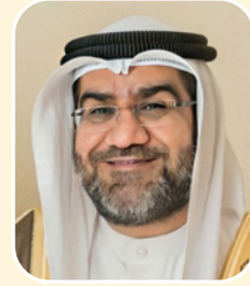
بقلم: الشيخ عبد الناصر عبد الله

هذا الذي يربطنا بفلسطين: دين وعقيدة، قرآن وسنة، سيرة وتاريخ، بطولات وتضحيات. فلسطين منا في القلب، في العقل، في الضمير، في الوجدان، إلى يوم الدين.