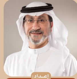
إعداد: أ.د. هاشم محمد نور المدني