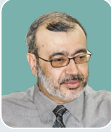
بقلم: محمود جناحي