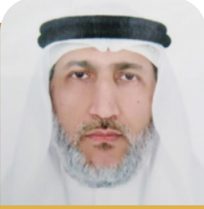
بقلم: د. خالد السعد