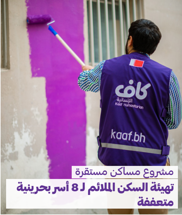
مشروع مساكن مستقرة تهيئة السكن الملائم لـ 8 أسر بحرينية متعففة