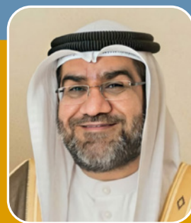
بقلم: الشيخ عبد الناصر عبد الله

ولكن الأزمة تزداد تفاقمًا حينما يتكلم كل واحد منا فيما لا يعنيه، وينظر فيما لا علم له به.. تزداد المشكلة سوءًا حينما يأتي المرجفون بأخبار كاذبة، أو ينشرون معلومات مغلوطة، أو يعممون بيانات لا أساس لها من الصحة، أو يشككون في قدرات المختصين، لأن ذلك من شأنه أن يُحدث الاضطراب، ويوهن العزائم، فربما صدّق بعض الناس هذه الأراجيف، فتأثروا بها سلبيًا وتناقلوها بينهم.. والنبي ﷺ يقول (كفى بالمرء كذبًا أن يحدث بكل ما سمع).