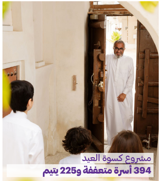
مشروع كسوة العيد 394 أسرة متعففة و 225 يتيم