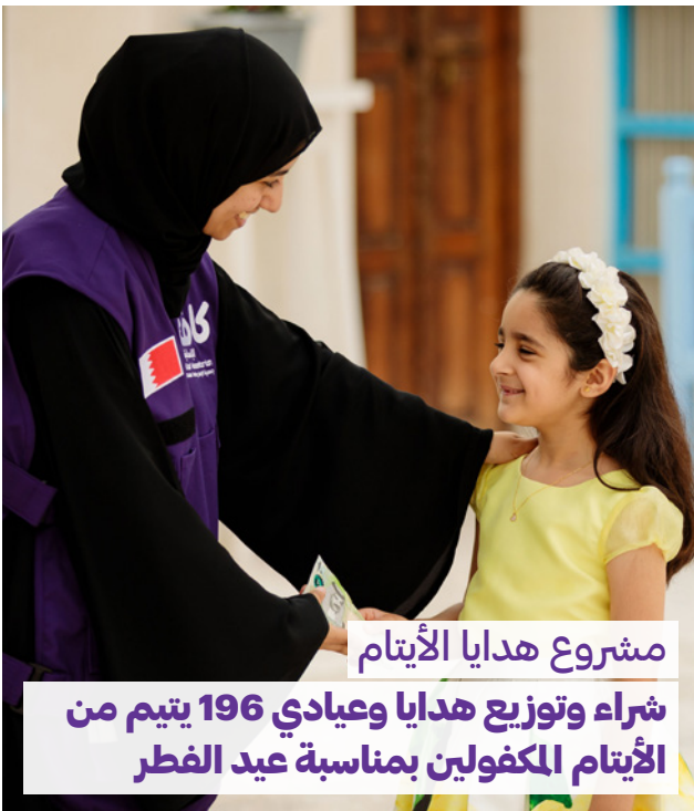
مشروع هدايا الأيتام شراء وتوزيع هدايا وعيادي 196 يتيم من الأيتام المكفولين بمناسبة عيد الفطر