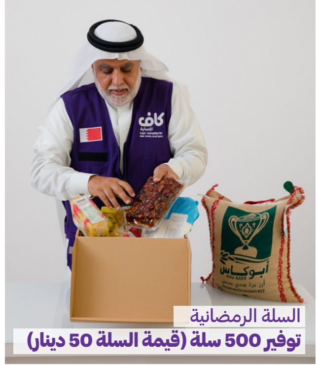
السلة الرمضانية توفير 500 سلة (قيمة السلة 50 دينار)