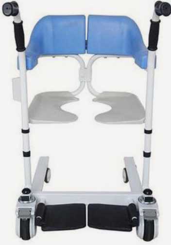
مبادرة كرسي المسن

إنتاج 50 كرسي بتصميم مبتكر يُسهّل حركة كبار السن ومن يعانون من صعوبة الحركة بالتعاون مع جمعية البحرين لرعاية الوالدين وذلك لتيسير حياتهم اليومية، قيمة الكرسي 150 دينار يُهدى لمن يحتاجه من الأسر البحرينية المتعففة.