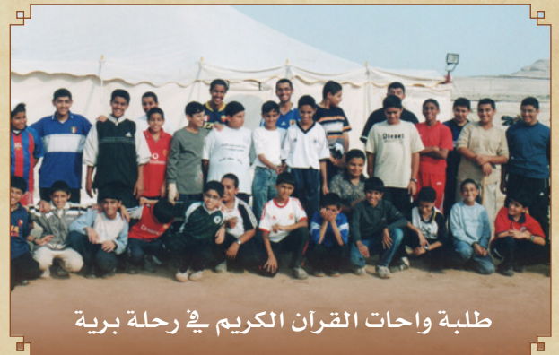
طلبة واحات القرآن الكريم في رحلة برية