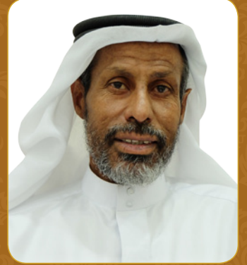
إعداد: أحمد علي المطاوي

ليس أروح للمرء، ولا أطرُدْ لهُمومه، ولا أقرّ لعينه من أن يعيش سليم القلب، مبرأ من وساوس الضغينة، وثوران الأحقاد، إذا رأى نعمة تتساق إلى أحد رضي بها، وأحس فضل الله فيها، وفقر