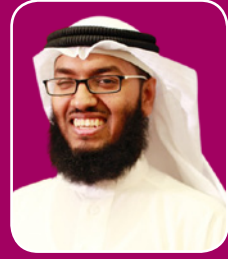
بقلم: الشيخ د. خالد الشنو