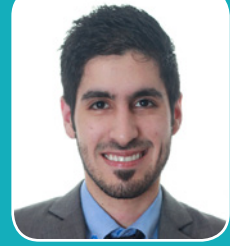
بقلم: زياد المدني

والحديث هنا لا يقتصر على التخصص في العمل أو التخصص