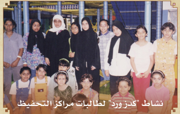
نشاط "كدرورد" لطابيات مراكز التحفيظ