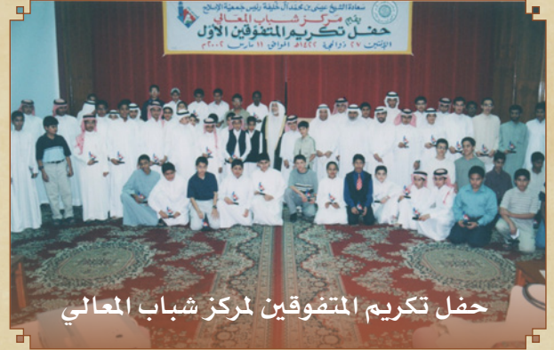
حفل تكريم المتفوقين لمركز شباب المعالي